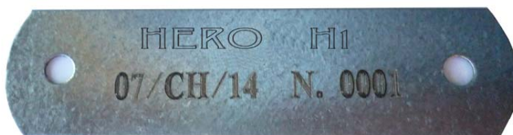
Foto della placchetta che evidenzia il n° di omologa, il nome del modello e il n° del telaio, la stessa dovrà essere fissata nella traversa posteriore B5 verso il centro del tubo stesso.